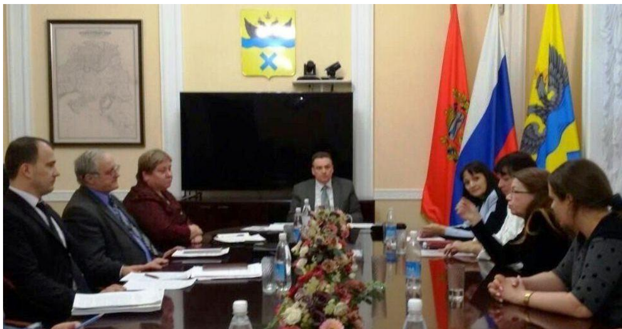
На фото: Рабочая встреча с главой МО г. Оренбурга