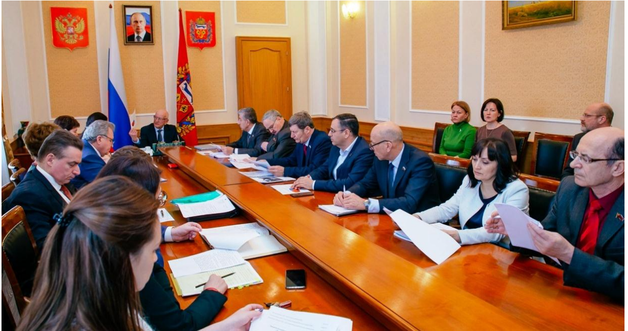
На фото: Рабочая встреча с Губернатором Оренбургской области

"Как сохранить исторический центр Оренбурга?", этот вопрос активисты ОРО ВООПИиК обсуждали на встрече 9 августа с главным архитектором города.